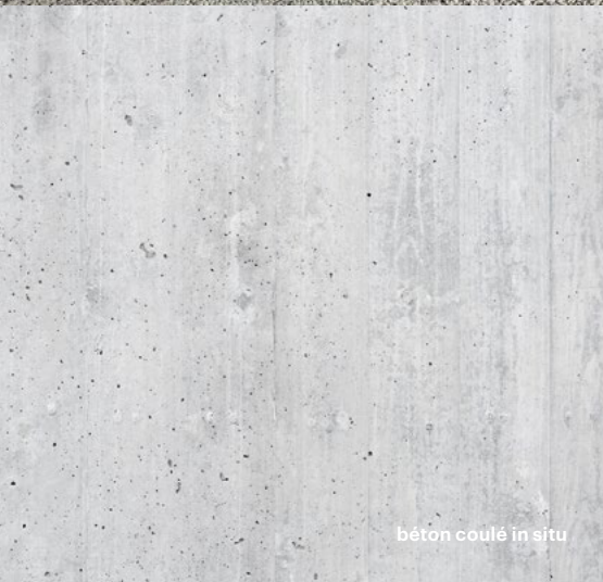
béton coulé in situ