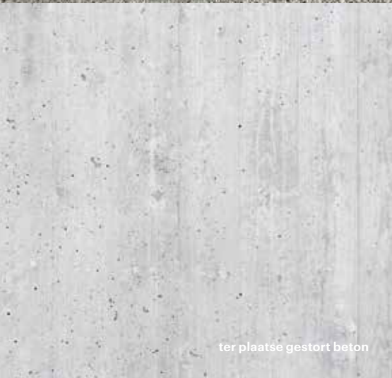
ter plaatse gestort beton