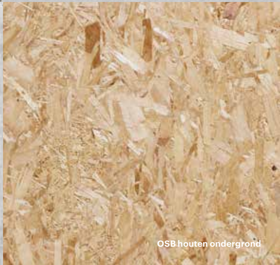
OSB houten ondergrond