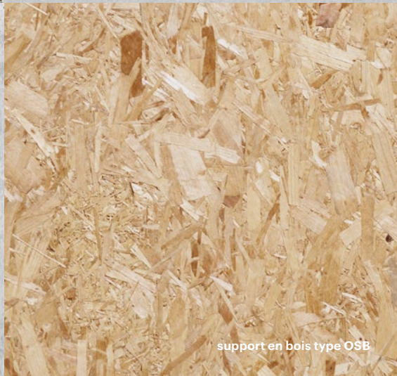
support en bois type OSB