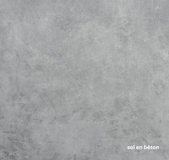
sol en béton