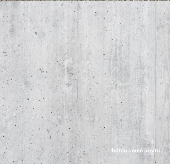
béton coulé in situ