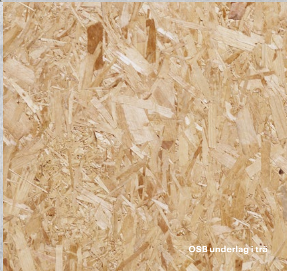
OSB underlag i trä