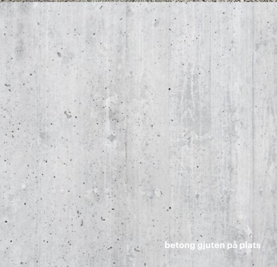
betong gjuten på plats