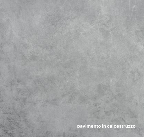
pavimento in calcestruzzo