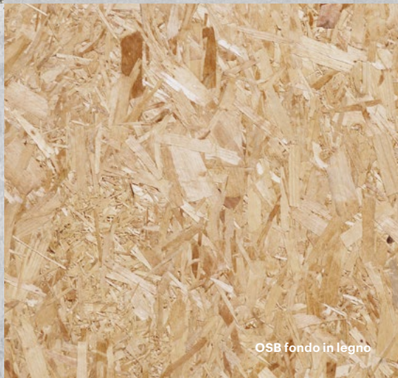
OSB fondo in legno