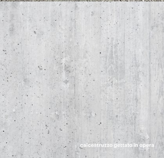
calcestruzzo gettato in opera