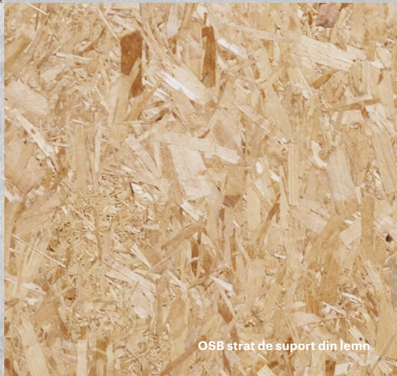
OSB strat de suport din lemn