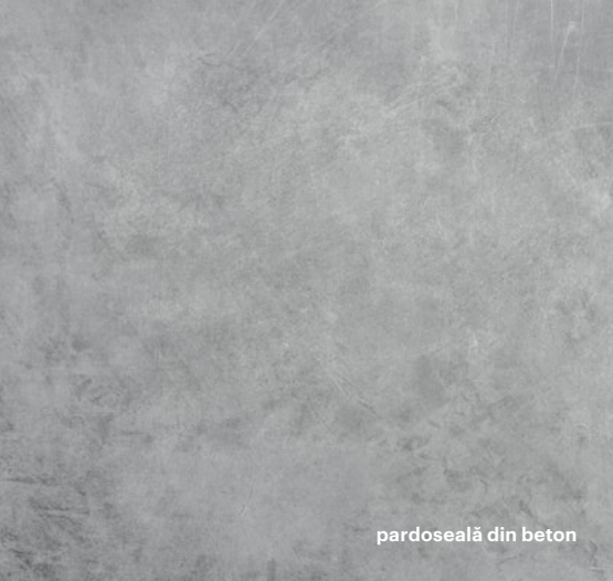
pardoseală din beton