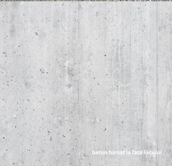
beton turnat la fața locului