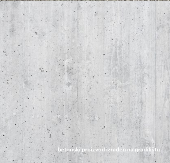
betonski proizvod izrađen na gradilištu