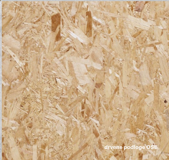
drvene podloge OSB