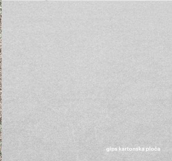
gips kartonska ploča