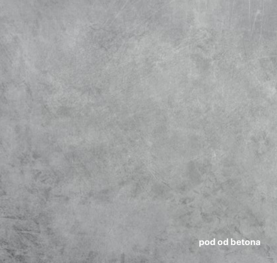
pod od betona