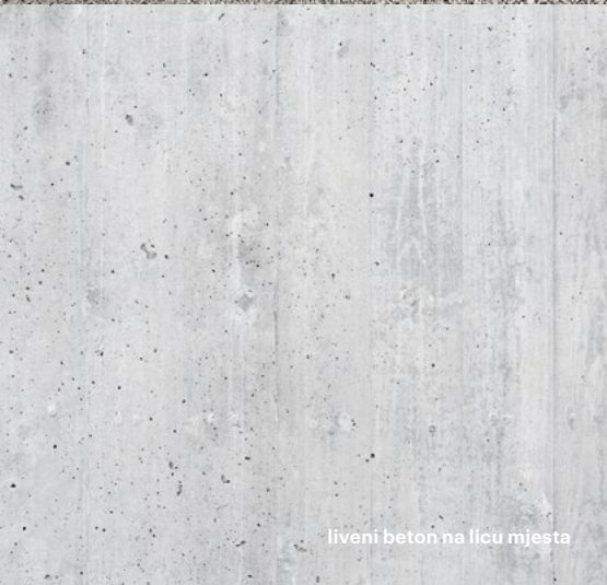
liveni beton na licu mjesta