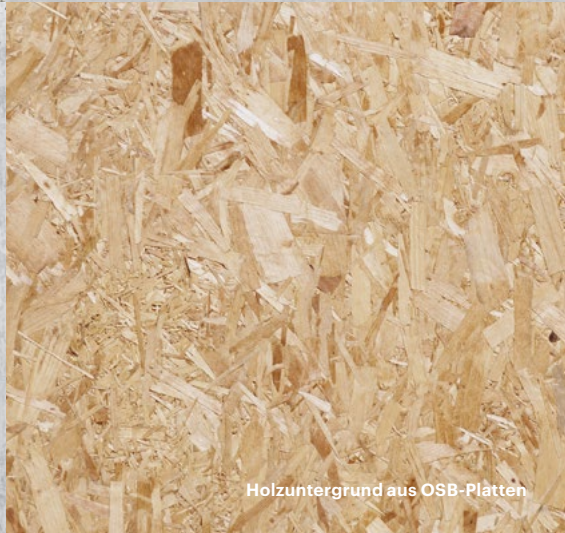
Holzuntergrund aus OSB-Platten